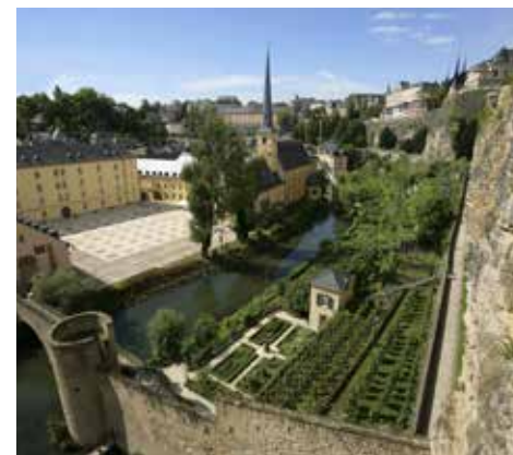
Dzielnica Grund

Gwarancje udzielone na mocy traktatu londyńskiego nie przeszkodziły oddziałom niemieckim w inwazji na Luksemburg w 1914 roku. Okupacja ograniczała się do sfery wojskowej. Władze luksemburskie protestowały przeciwko inwazji niemieckiej, zachowując jednak ścisłą neutralność wobec walczących. Wielka Księżna Maria-Adelajda i rząd pozostały na miejscu, co miało swoje konsekwencje polityczne po zakończeniu I wojny światowej.